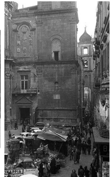
Piazza San Gaetano