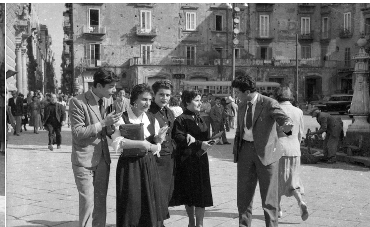
Piazza del Gesù