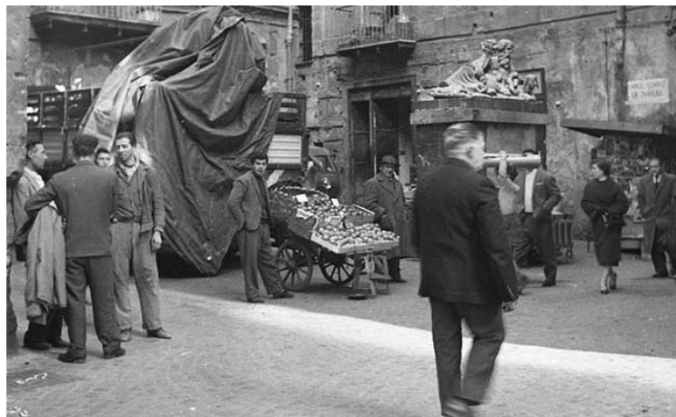
Largo Corpo di Napoli